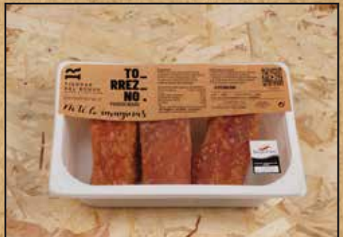
Torrezno precocinado PREMIUM. Bandejas de 500g. y 1.500g.