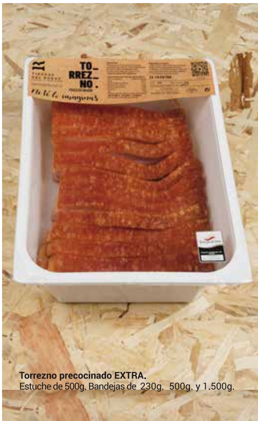
Torrezno precocinado EXTRA. Estuche de 500g. Bandejas de 230g, 500g, y 1.500g.