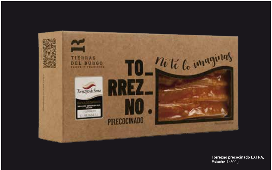
Torrezno precocinado EXTRA. Estuche de 500g.