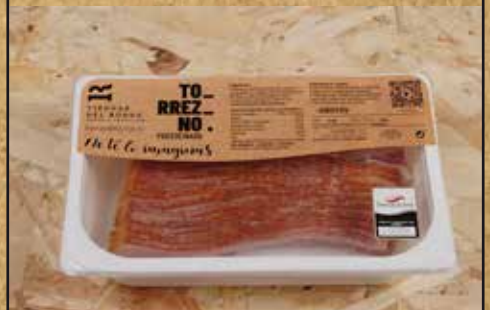
Torrezno precocinado VIRUTAS Bandejas de 230g, 500g. y 1.500g.